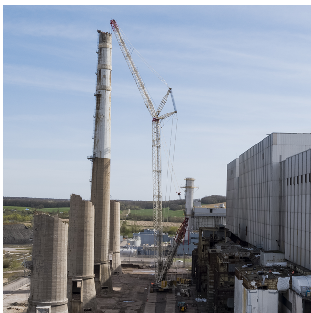
Potence de démolition équipée d'une AIO 601 et d'une CU042