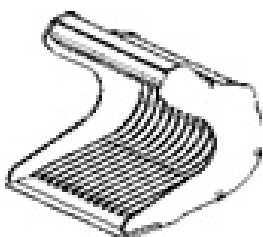
Profil na rozoberanie dlažby