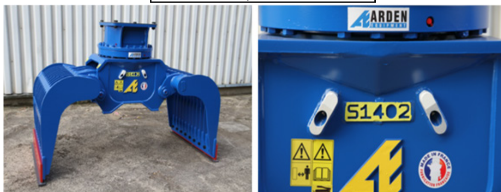
S1402 - option Arden Jet