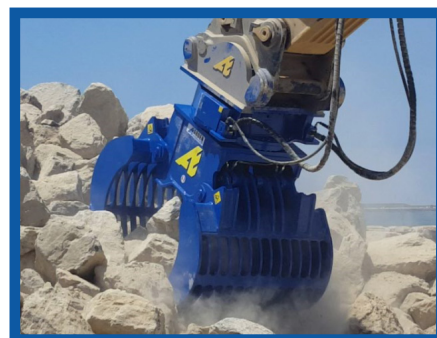
Vue d'une pince S6002

En standard, toutes sont équipées d'une rotation 360° avec couronne + 1 ou 2 moteurs. Les moteurs des rotations sont protégés contre une surpression ou un sur débit temporaire. Les moteurs ne nécessitent pas de ligne de drain supplémentaire.