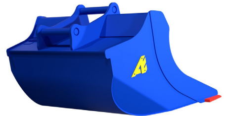
Vista trasera de un C30TR1