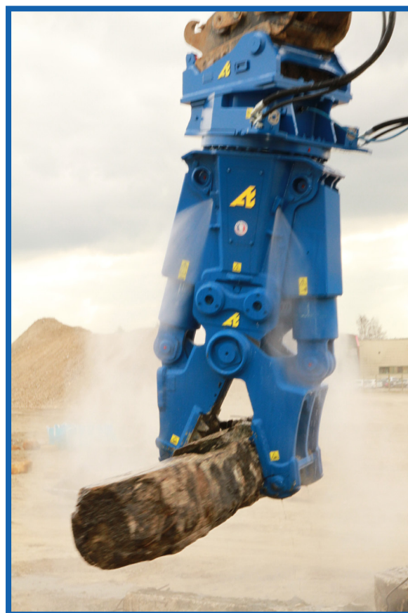
Visuel d'une CU031BB avec l'Arden Jet

Données techniques et visuels non contractuels, susceptibles d'être modifiés sans préavis.