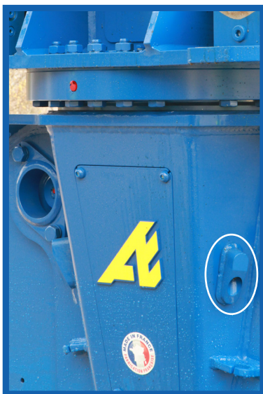
Buses de l'Arden Jet