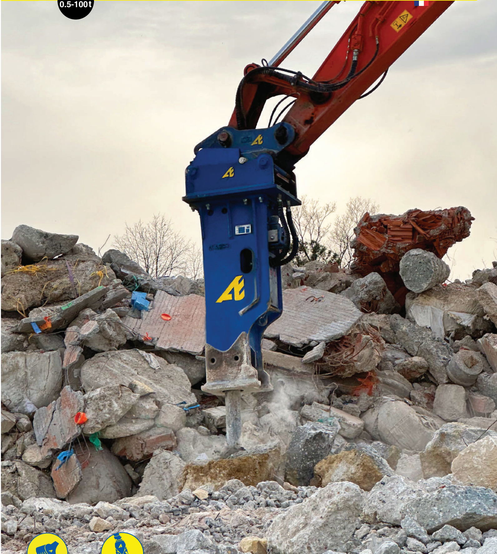
imprimé par Fusion Graphic 4 Rue François Urano, 08000 Warcq - Ne pas jeter sur la voie publique